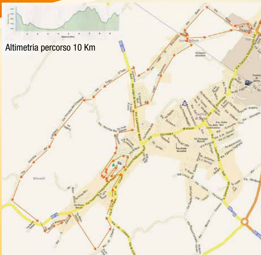
Altimetria percorso 10 Km

PASSEGGIATA LUDICO MOTORIA DI 10 KM ISCRIZIONE SUL SITO www.prolocotorritadisiena.it OPPURE PRESSO UFFICIO TURISTICO DI TORRITA DI SIENA